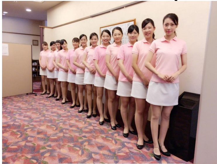
ピンクポロシャツ+白ミニスカート