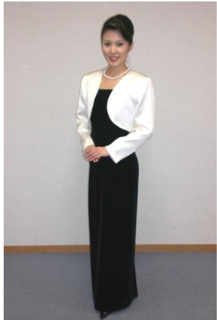
ボレロ+ロングドレス(黒・紺)