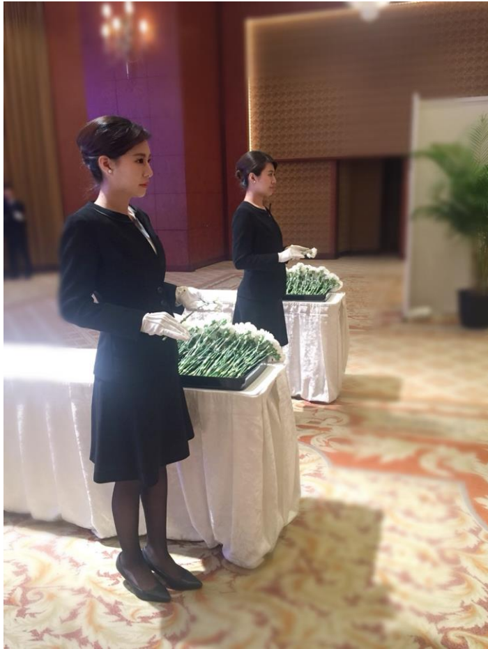
受付・献花 黒スーツ(黒ストッキング)