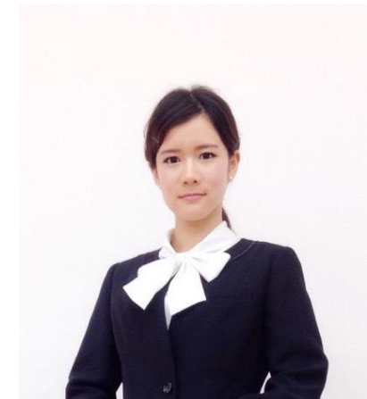
棒タイブラウス (数に限りがございます)