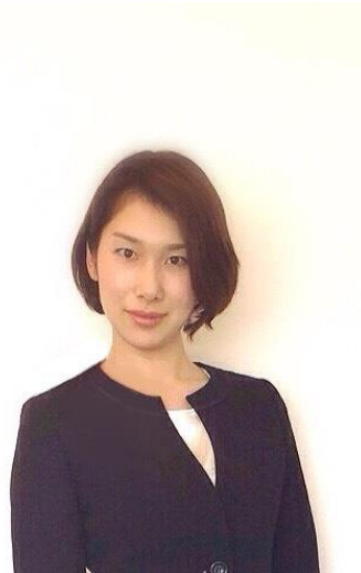
黒ロングゴレス(黒くすみボタン)