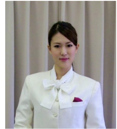
棒タイブラウス (数に限りがございます)