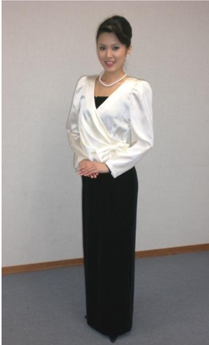
横リボンブラウス+ ロングドレス(黒・紺)