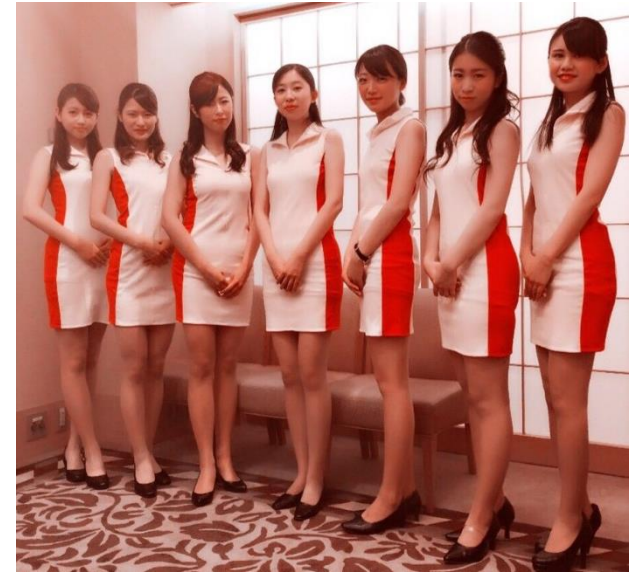
マイスターガール